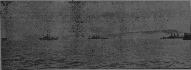
Una sección de la flota turca haciendo un disparo colectivo. La primera faz de la guerra se ha resuelto en mar y la flota turca ha llevado la peor parte; es de esperar un día de estos un combate decisivo entre el grupo de las dos arcadas que no han entrado aún á la pelea.

Gran excitación causó en Cartago la presencia allí de un "Hombre Malo" que persigue en cueros á las niñas y señoritas, sembrando terror en la sociedad